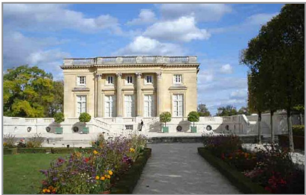
A Trianon palota

– Ez a kegyetlen tapasztalatokra épülő megállapítás A szabadság ára című filmben is sokoldalúan érthető és átélhető lesz. De igazán fájdalmas felismerés, hogy a titkosszolgálatok milyen mértékben tudtak beépülni a magyarországi és a felvidéki közösségekbe, jelentősen megnehezítve a kibontakozást. Duray likvidálása a '90-es évek közepén eldöntött politikai szándék volt, sőt még tíz évvel ezelőtt is az autópálya szalagkorlátjához szorították. S ne feledjük: Alexander Dubček autóbalesetének és halálának okait sem tárták fel a nyilvánosság előtt. Vajon miért? Duray Miklóst 2008. augusztusában forgatócsoportunkkal nem engedték be a Pozsony szívében magasodó Szent Márton-katedrálisba, azaz a magyar királyok koronázó templomába. Személye nem kívánatos, mert „politikai indulatokat” gerjeszt. Így